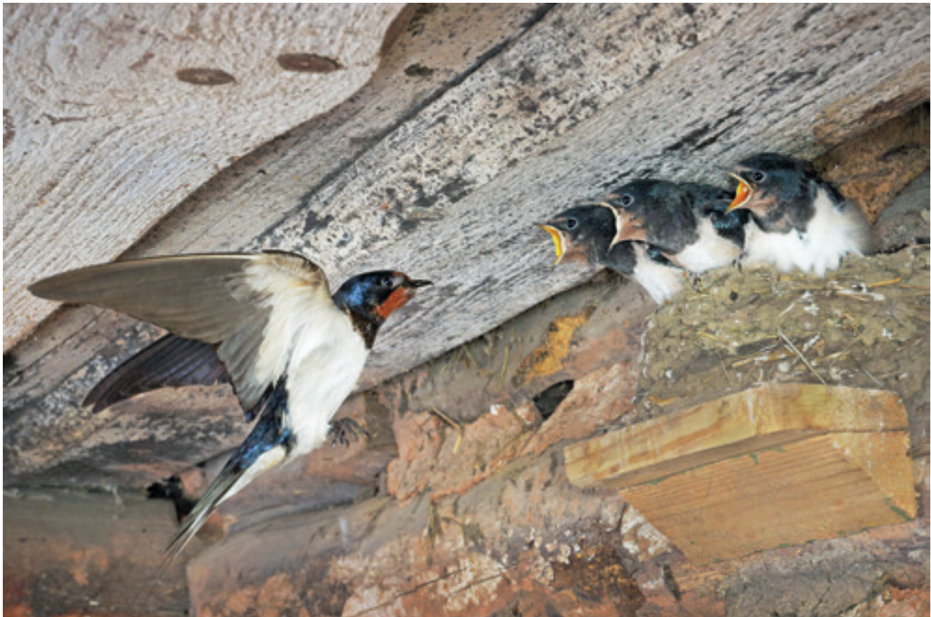
Kuniks veel on karjalautu, kus pääsud pesitseda saavad, on ka suitsupääsukesel Eestis tulevikku. Pildilt on näha, et pesa on laujupiga toetatud

Pikemalt on rahvuslinnu valimisest kirjutatud Eesti Looduse 2011. a detsembrinumbris.