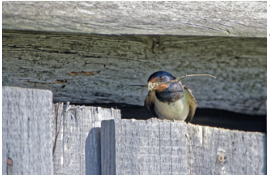
Endiselt jäetakse suveks aidauks irvakile või pööninguluuk lahti, et pääsukesed ikka oma pesapaikadele ligi pääseksid

Võib-olla aitab suitsupääsukeste sage figureerimine Eesti ja eestluse sümbolina kaasa sellele, et pääsukestel lastakse ikka edasi pesitseda, tekkiva mustuse pärast ei pahandata ega lõhuta nende pesi, vaid hoopis teostatakse lauajupiga. Küllap nii mõnedki maal kasvanud lapsed oskavad jutustada sellest, kuidas pääsuke